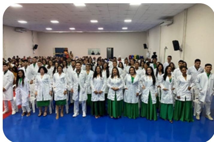
I Semana de Fisioterapia celebrando a ciência nos ambientes de prática da profissão