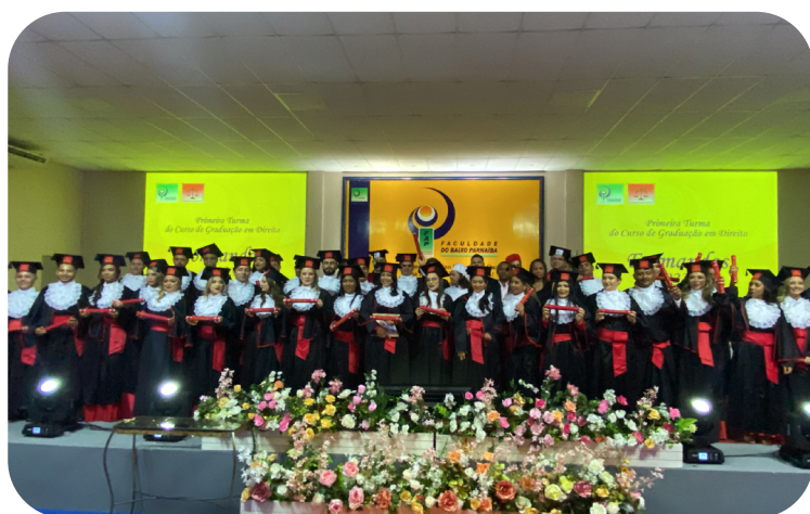
Colação de grau da primeira turma de Direito da FAP